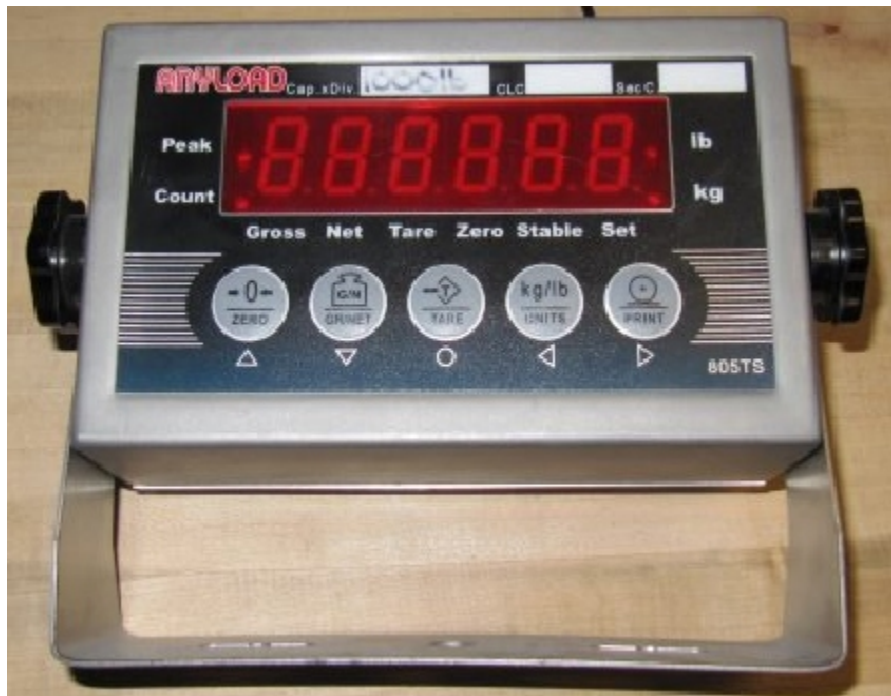
Typical model 805TS / Modèle 805TS typique