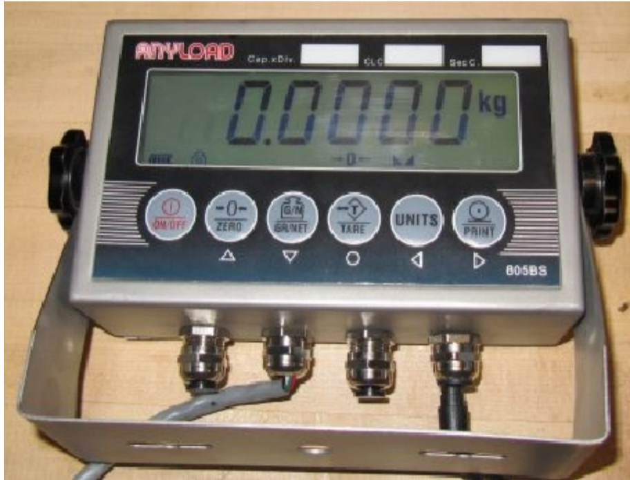
Typical model 805BS / Modèle 805BS typique