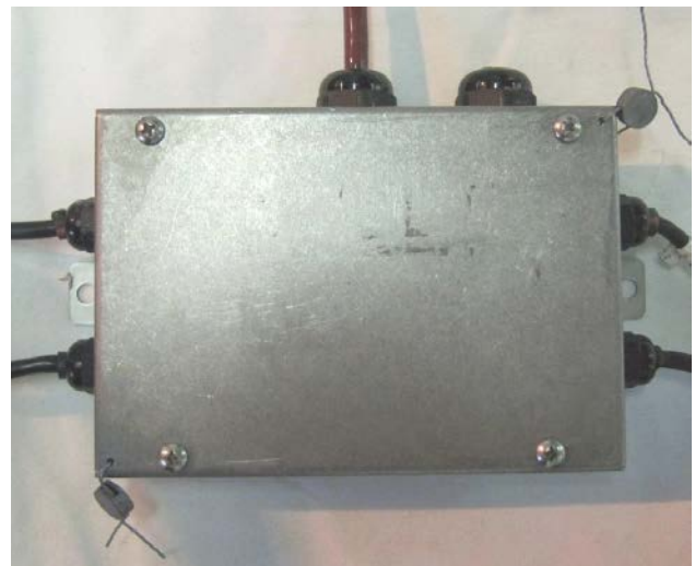
Typical Junction Box Sealing / Scellage typique de la boîte de jonction